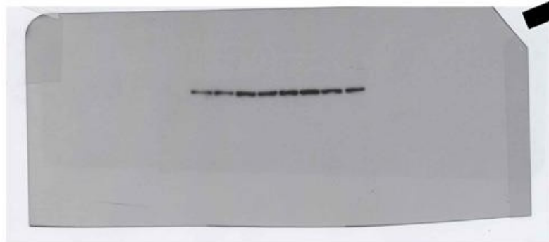
RGB; 121.52 cm wide, 96dpi (4593 x 1985 px); TIFF format using LZW (lossless) compression; File size = 15.1 MB